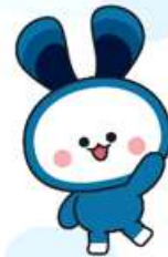
개선 후 캐릭터 디자인