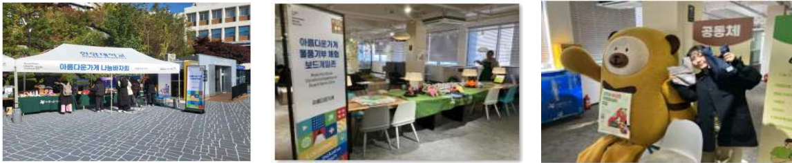
대학 내 외국인 교환학생 기부 참여를 위한 팝업부스 운영