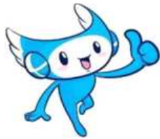
개선 전 캐릭터 디자인